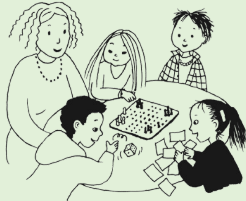
Illustration: Erika Eklund Wilson

Spel med anpassade frågor, gärna döpt efter skolan. ex: "Lillbäcksspelet"